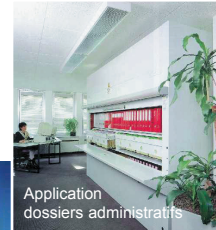
Application dossiers administratifs

Le "Shuttle" est un stockeur-distributeur vertical automatisé. Un système électronique mesure la hauteur des produits à emmagasiner et achemine, au moyen d'une navette, votre marchandise dans un emplacement de hauteur correspondante.